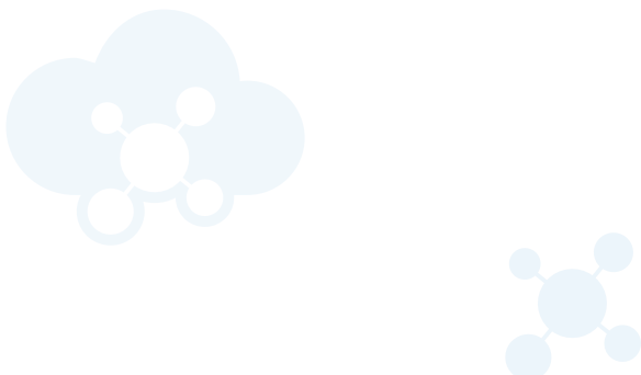
图二：易保云中台现状